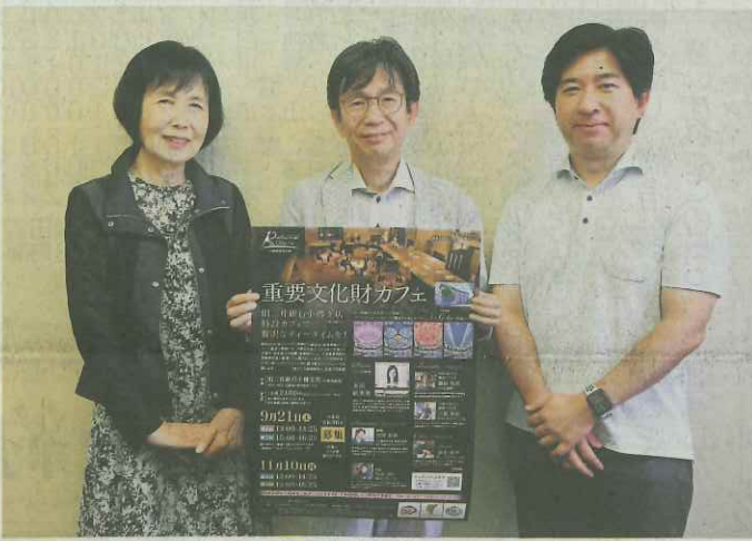
まち歩きツアーや重要文化財カフェをPRする 実行委メンバー

小樽市民や観光客に定番の観光スポットとは違う魅力を知ってもらおうと、まち歩きツアー「小樽再発見の旅」が今月始まった。旅行商品化を目指した試みで、参加者を募集している。 小樽観光協会や小樽市商店街振興組合連合会女性部、小樽地域遺産連合会などでつくる実行委が企画。観光庁の本年度補助事業で行っている。