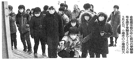
合同発表会の中に自分の発表者を探そうと、札幌市立大の学生たちが集まる様子。3月6日、小樽市の小樽商科大