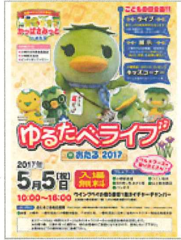
ゆるたベライブinおたる 2017