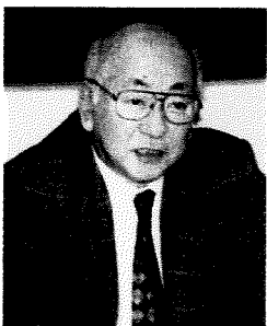
守分寿男

北海道旭川市生まれ。1939(昭和14)年、旭川市立高等女学校卒業後に小学校教員を務めるが、敗戦後に軍国主義教育の過ちに気づき退職。肺結核などの病魔のなかにあり受洗。1964(昭和39)年、朝日新聞社大阪本社85周年・東京本社75周年記念の1000万円懸賞小説に『氷点』を投稿して入選。朝日新聞紙上にて連載を開始し、単行本はベストセラーとなる。その後も病弱な身を押し、『塩狩峠』(1968年)、『細川ガラシャ婦人』(1975年)、『天北原野』(1976年)、『母』(1992年)、『銃口』(1994年)など、キリスト者としての信仰を投影した小説作品やエッセイなどを発表。1999(平成11)年没。1998(平成10)年、旭川市に三浦綾子記念文学館が開館し、三浦の作品の魅力やその生涯を多くの人々に伝えている。